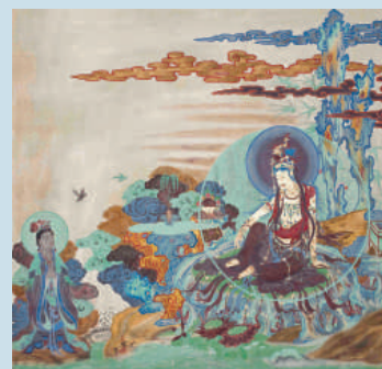
「水月觀音」榆林窟第2窟（西夏） 李承仙臨摹