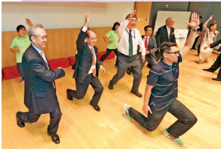
（左起）馬會副主席周永健、勞工及福利局局長張建宗及中大校長沈祖堯和與會者做健身操，推廣預防衰老及持續運動的重要性。