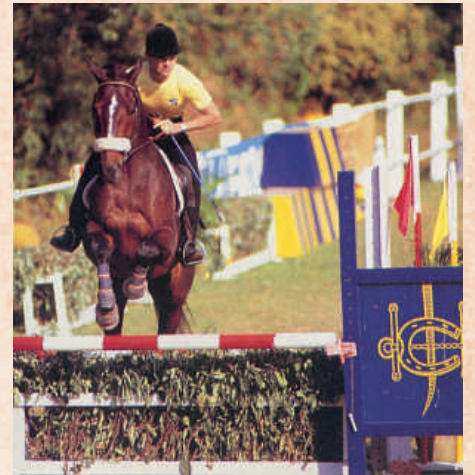
80年代於雙魚河進行的馬術示範