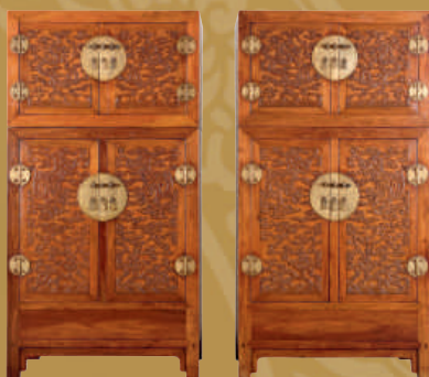
黃花梨龍紋頂箱立櫃一對 (洪建生先生藏)

十多年前和一班公共行政碩士班的同學，到北京清華大學交流，當時經常陪一名古玩達人到抗日戰爭紀念館附近的宛平城古玩街找尋心頭好，聽他細說如何鑑別古玩真偽、青花瓷器的種種，以及看他和商販討價還價的過程，讓我大開眼界，產生了對文物古玩的興趣。這次展出的精品，件件都是精緻的無價寶，自然不是古玩市場的民間玩物可比，不過當天的經歷，卻為今天看這些珍藏打了個很好的底子，看展覽時多了份美好的回味。