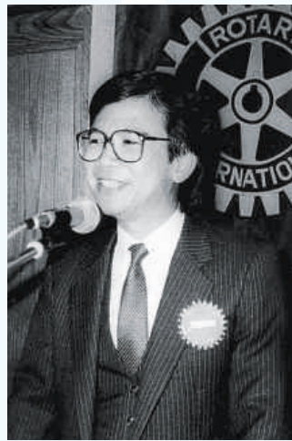
林煥光1984年接替前特首曾蔭權，出任沙田政務專員。

每逢跑馬日，家中一定有馬經，那是他童年回憶的一部分。「小朋友不可以入馬場，就在跑馬地中央公園隔著欄邊看，龐大動物在眼前近距離高速競賽，好難忘。」隨年漸長，他對賽馬又有另一番體會，「賽馬是thinking game，是智力遊戲，用哲學角度看，與人生十分相似。」他說：「勝負包含很多因素，馬匹排檔、騎師的狀態、練馬師的戰術，還有無法預計的天氣，都會影響賽果。」哪一匹馬跑出，馬迷只能掌握部分因素，馬評人總掛在口邊的「態佳路合」，就如人生。