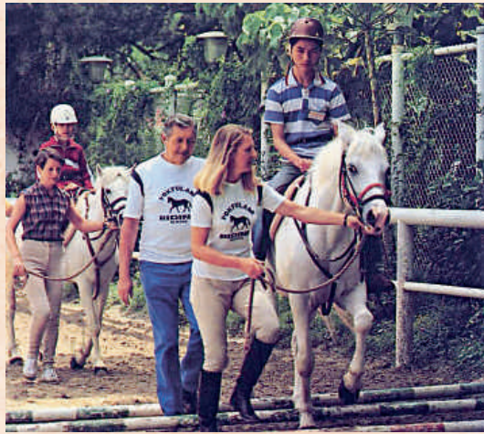
薄扶林公眾騎術學校為傷健策騎協會提供馬匹及設施，進行策騎治療。