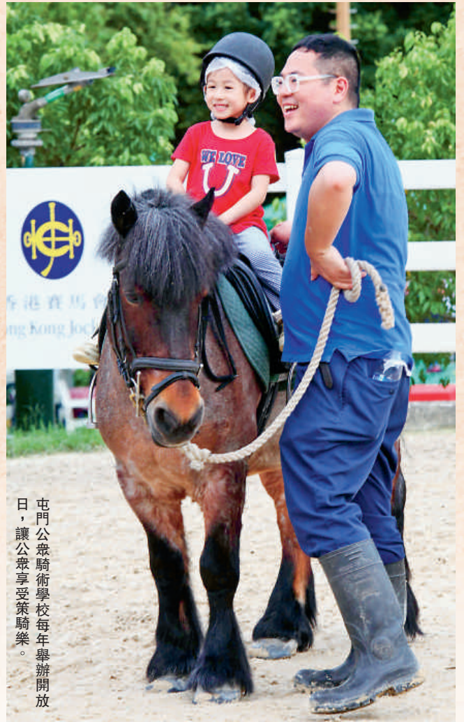
屯門公眾騎術學校每年舉辦開放日，讓公眾享受策騎樂。

時至今日，雙魚河仍然是香港馬術運動的溫布萊，能夠來這裡比賽，是騎手的心願。雙魚河出過好幾位馬術精英，他們在這裡學騎馬，最終被挑選加入馬會馬術隊，揚名國際賽場。