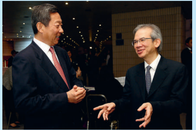
馬會主席葉錫安博士(左)及行政會議召集人林煥光(右)，在第43屆香港藝術節開幕禮上聚頭。