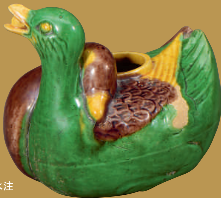
素三彩交頸鴛鴦水注 (長青館藏)

未有孩子以前，到外地旅行，很多時都會逛當地的博物館。無論是東京、倫敦、巴黎等大城市，還是英國某些名不經傳的小鎮，總會有好些值得花時間參觀的博物館。羅浮宮或大英博物館固然是遊客必到的勝地，仔細參觀的話，真不知要逛多少天，但很多小型博物館都有各自的特色，多看幾個展覽，不單能增進知識，還可以激發思考，或許能悟出些道理也不一定。