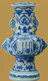
正德款青花如意 勾蓮阿拉伯文瓷 尊 (藝德堂藏)