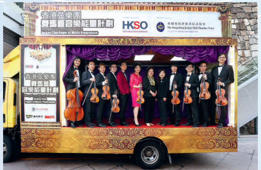
「賽馬會音樂能量計劃」派出樂手走訪 18 區，向各階層發放音樂正能量。