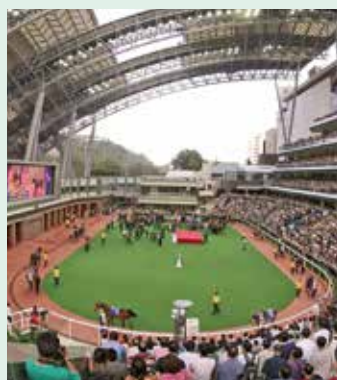
2004年馬匹亮相圈建成了全球首個開合式天幕，馬迷不論陰晴皆可檢視馬匹賽前狀況。