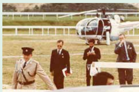
港督麥理浩（右一）乘坐直升機蒞臨沙田馬場主持開幕儀式，可以從中看出沙田區當年交通狀況的一點端倪？