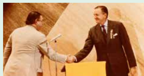
沙田馬場於1978年10月7日正式啟用，由當時的香港總督麥理浩爵士主持揭幕。圖為麥理浩爵士（右）與香港賽馬會主席韋彼得。