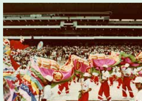
沙田馬場於1978年10月7日正式啟用，現場有舞龍助興，十分熱鬧。