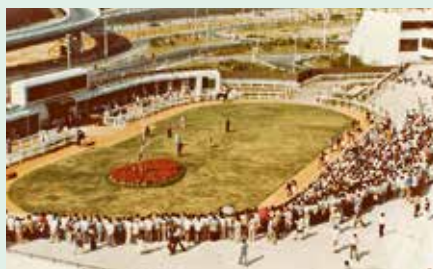
馬場開幕當天，馬迷聚集在沙田馬場的馬匹亮相圈，當時天幕仍是開放式的。