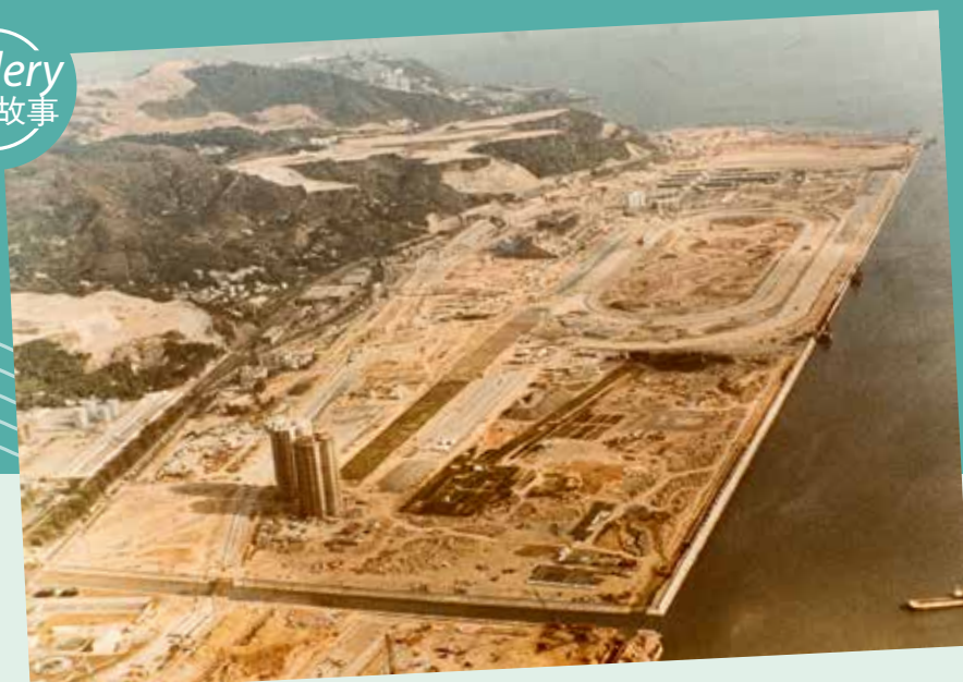
1977年，沙田新市鎮填海工程大致完成。