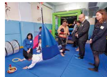
心光賽馬會視障幼兒支援服務中心設有多間針對不同訓練用途的獨立房間。