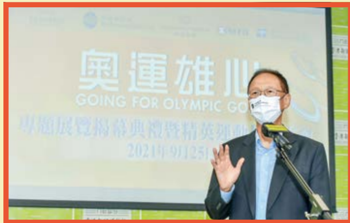
「奧運雄心」專題展覽為期五個月。圖為主持揭幕禮的馬會主席陳南祿。