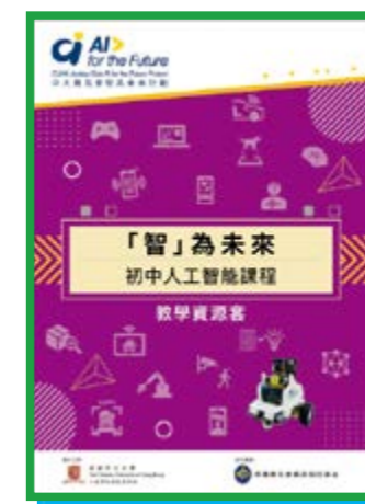
計劃發表的免費 AI 教學資源套，協助初中學生在 AI 的認知和技能方面打下基礎。

人工智能 (AI) 近年應用越趨普及，為協助年輕一代迎戰數碼世代，馬會慈善信託基金捐助香港中文大學工程學院及教育學院，開展中大賽馬會「智」為未來計劃，協助初中學生掌握 AI 知識。計劃於 2019 年開展，旨在為香港中學創建新的 AI 課程、可持續的 AI 教育模式及支援框架，促進 AI 教育生態發展。課程特別著重啟發學生在以人為本及符合倫理道德的前提下，於不同層面正面應用 AI。