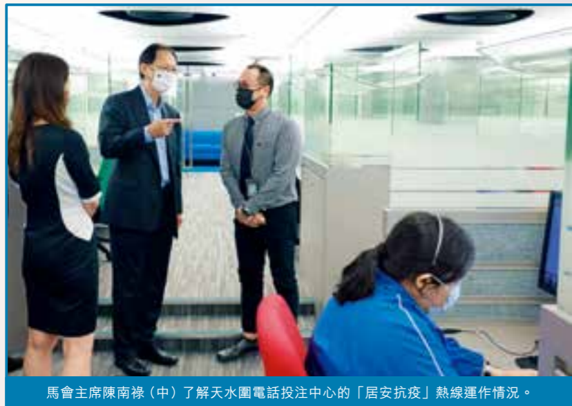
馬會主席陳南祿（中）了解天水圍電話投注中心的「居安抗疫」熱線運作情況。