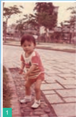
1 12:46 PM

純粹因為一份熱誠，我真的很喜歡彈鋼琴，媽媽回憶我小時候，看電視聽完一首廣告歌，已可即時演奏出來。當時除了覺得好玩，亦令我有一份成就感，不斷想再學多一點。此外，我從小就進出醫院接受外科矯形手術，父母覺得我長時間留在醫院，很少娛樂及興趣，知道我喜歡鋼琴都很支持我。直至我大學選擇主修鋼琴演奏，雖然他們有一點驚訝，但都認為我喜歡就可以，我真的很感謝他們。