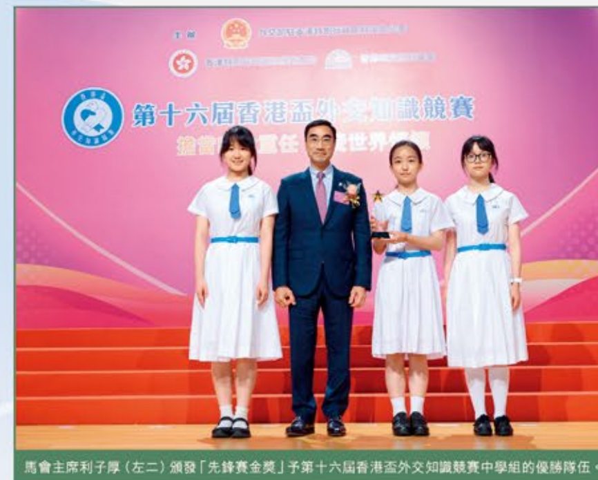
馬會主席利子厚（左二）頒發「先鋒賽金獎」予第十六屆香港盃外交知識競賽中學組的優勝隊伍。

競賽頒獎禮於5月中舉行，馬會主席利子厚擔任主禮嘉賓及頒發獎項予中學組的優勝隊伍。馬會副主席廖長江則擔任精英賽的評委。