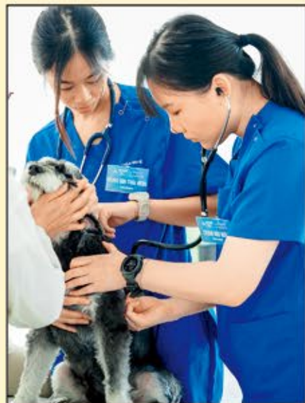
畢業在即，我（右）希望能夠將自己所學的知識，照顧每一隻求診動物的健康。