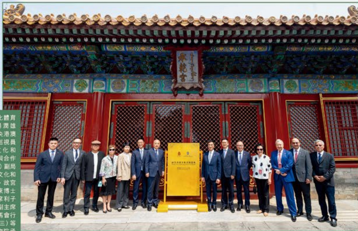
香港特區政府文化體育及旅遊局長楊潤雄（左六）；中共中央港澳工作辦公室二級巡視員許麗（左五）；文化和旅游部國際交流與合作局（港澳台辦公室）副局長孔倫（右六）；文化和旅游部黨組成員、故宮博物院院長王旭東博士（左七）；馬會主席利子厚（右七）；馬會副主席廖長江（右五）；馬會行政總裁應家柏（右三）等嘉賓，在故宮博物院承乾宮「故宮香港文化交流基地」牌匾旁合照。