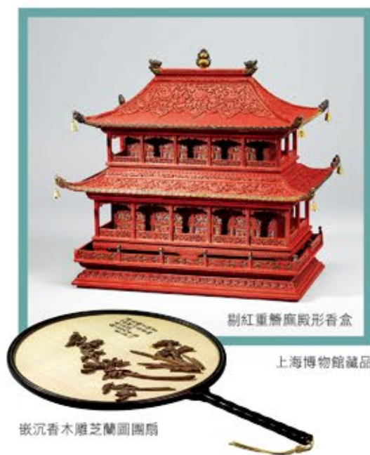
剔紅重簷殿形香盒