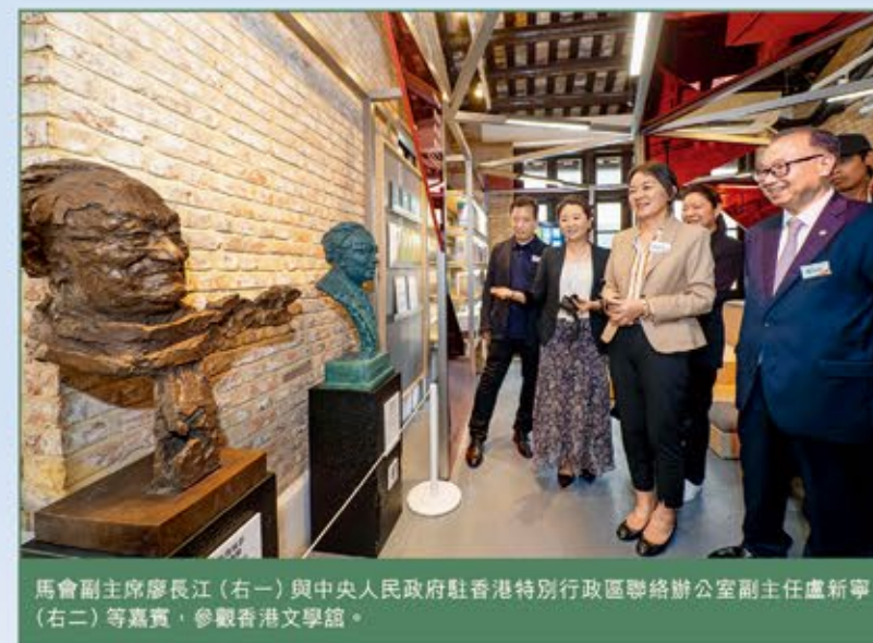
馬會副主席廖長江（右一）與中央人民政府駐香港特別行政區聯絡辦公室副主任盧新寧（右二）等嘉賓，參觀香港文學館。

位於灣仔的香港文學館集香港文學館藏、文學傳播、教育培訓、展覽與文藝沙龍為一體。館內結合現代數碼技術，介紹香港文學作品，提高青少年對文學閱讀和創作的興趣。該館旗下的賽馬會「流動文學館」計劃，更透過流動書車走進校園及社區，豐富學生及市民的文學體驗。