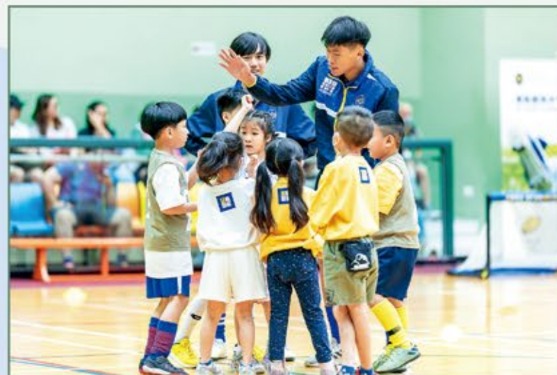
青少年足球領袖計劃的學員籌辦社區足球嘉年華，將計劃中所學的技能回饋社區。

馬會於2014年推出「賽馬會青少年足球領袖計劃」，今年從全港招募約60名15至19歲的青少年，透過初級足球教練課程、自我挑戰工作坊及社區足球服務等活動，訓練青少年的體能、心智及社交能力，並提升他們的領導才能。