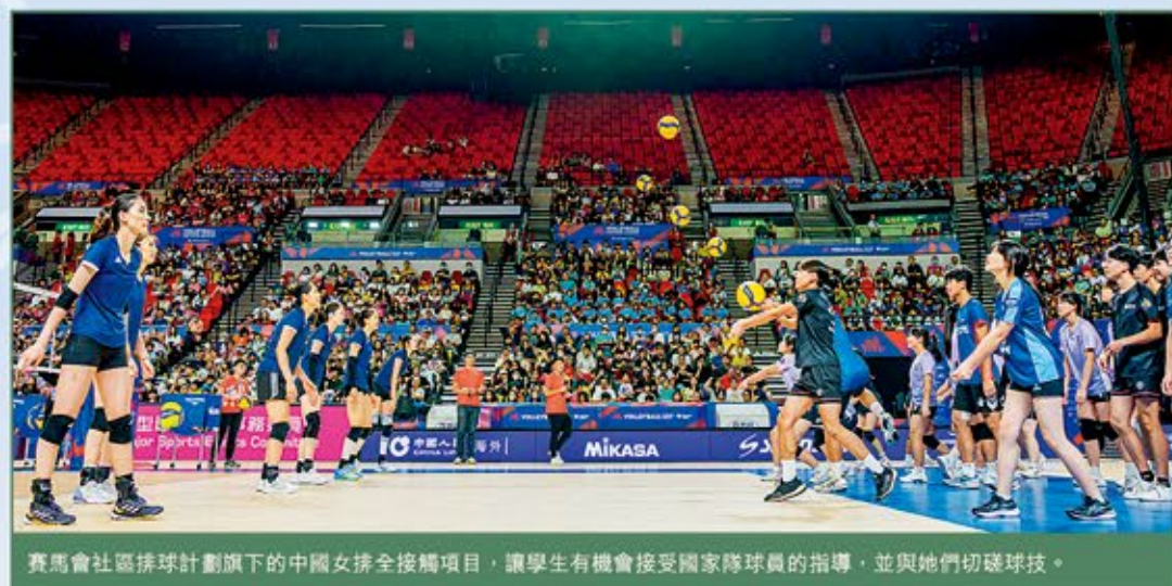
賽馬會社區排球計劃旗下的中國女排全接觸項目，讓學生有機會接受國家隊球員的指導，並與她們切磋球技。

有機會參與這項國際盛事，當中包括於6月舉辦了中國女排全接觸項目，邀請逾3,000位市民、學生和視障人士現場體驗中國女排的練習實況，一睹球員風采。大會更安排部分學生參加大師班，與國家隊球員互相切磋，並由她們親自傳授排球技巧。