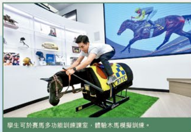
學生可於賽馬多功能訓練課室，體驗木馬模擬訓練。

課程的培訓基地、賽馬多功能訓練課室位於廣州黃村廣東體育職業技術學院的教學樓內，面積約