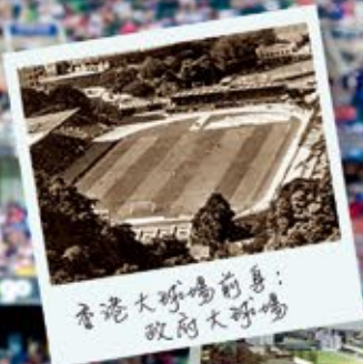
香港大球場前身：政府大球場