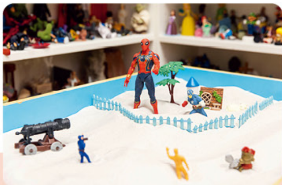
計劃安排遊戲治療，遊戲室有沙盤、模型等玩具讓孩子舒緩壓力和抒發感受。

很多人視結婚為人生必經階段，然而當婚姻出現危機，不少夫婦或未知如何應對？馬會慈善信託基金於2021年起捐助賽馬會「婚姻・再思」計劃，支援陷入婚姻危機的夫婦及其子女，協助他們尋找未來路向，為關係緊張的夫婦提供一個新出口。我以婚姻輔導員身份參與計劃約三年，從不少個案中領悟到：婚姻就是在尊重自己與尊重對方之間，找一個平衡點。