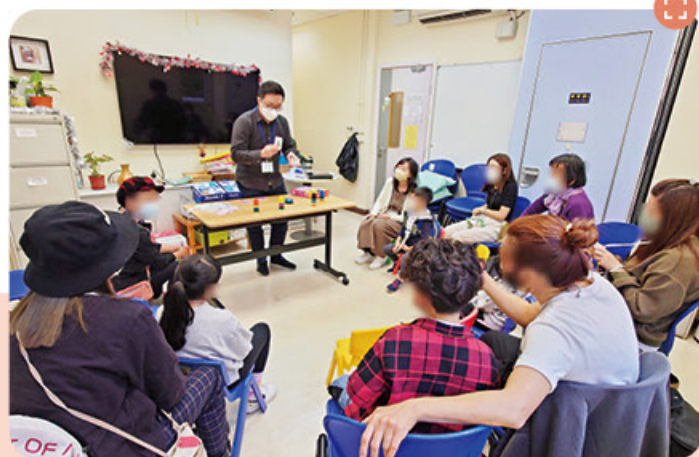
父母與孩子一同參與「心心相印」親子小組，重新感受對彼此的關愛。