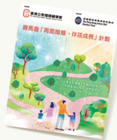
賽馬會「再思婚姻・伴孩成長」計劃支援陷入婚姻危機的夫婦及其子女。