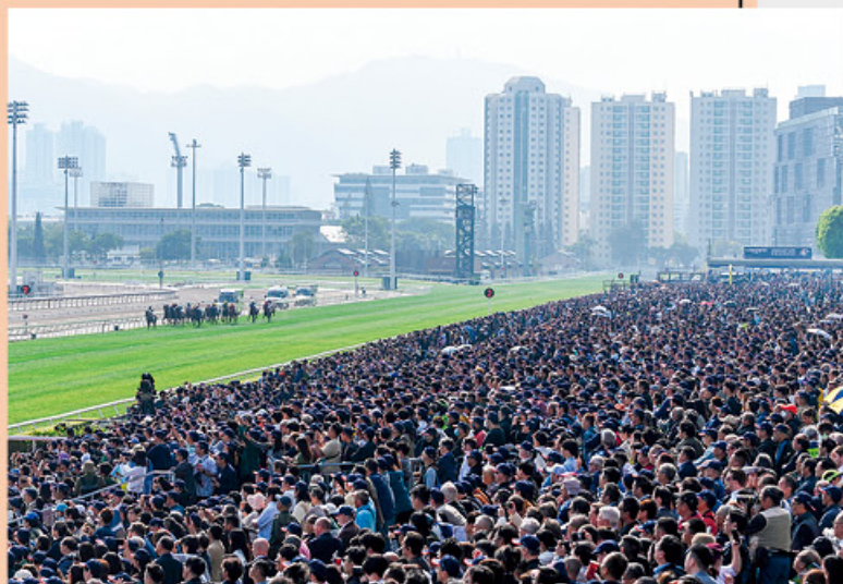
2024年香港國際賽吸引逾八萬人入場觀賞。

馬會行政總裁應家柏表示，香港國際賽成功吸引全球的注視，贏取了全球的認可，對香港的形象極具正面意義。他稱，香港國際賽事凸顯了賽馬旅遊的巨大潛力，吸引了來自日本、澳洲及法國的中高端旅行團，更有不少海外及內地馬迷慕名而來，為本港經濟加添動力。