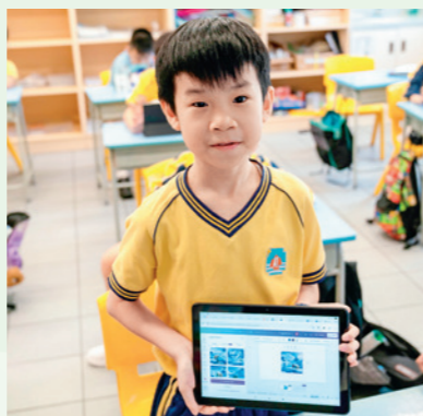
參與計劃的學校學生利用 AI 生成故事繪本。