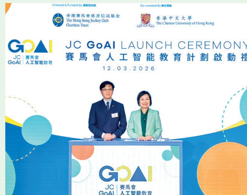
香港特別行政區政府教育局局長蔡若蓮 (右) 及馬會董事陳衍里 (左) 於 3 月 12 日為「賽馬會人工智能教育」計劃主持啟動禮。

馬會透過其慈善信託基金策劃及捐助逾 2 億 5,500 萬港元，並與香港中文大學聯合推出為期四年半的「賽馬會人工智能教育」計劃，將 AI 學習元素，融入中小學各學科的課程中，讓教師善用 AI 輔助教學，從而系統地從多方面支援高小及初中的人工智能教育，藉此推動數字教育的高質量發展。