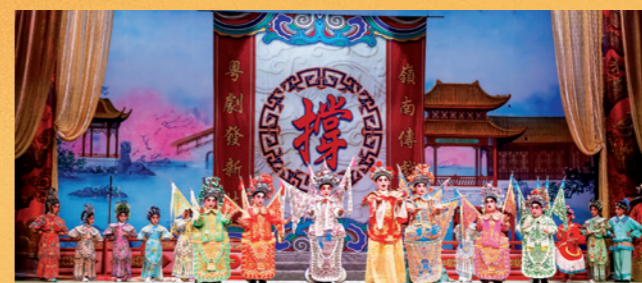
「賽馬會查篤撐兒童粵劇推廣計劃」培養學生對於粵劇藝術的欣賞及興趣。

服飾方面，粵劇早期以模仿明代的衣冠式樣製作，及後受京劇影響，兼具刺繡特色與珠片裝飾的華麗風格。粵劇化妝流行濃脂厚粉，顏色以紅、黑、白、藍、黃為主，用以象徵角色性格忠奸，而不同角色皆有獨特的化妝方式。