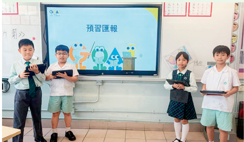
參與計劃的學校學生透過 AI 生成匯報文稿。