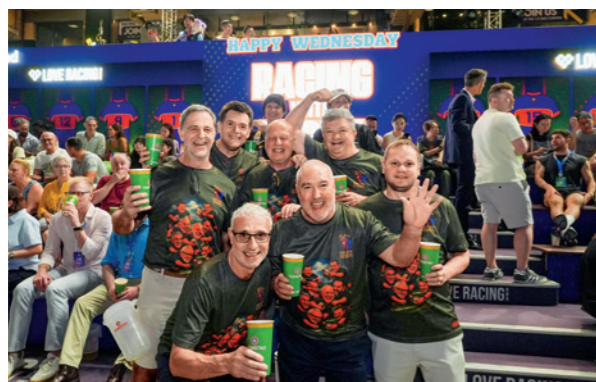
跑馬地馬場設「打氣區」，球迷吶喊為欖球賽提前造勢。

欖球運動有龐大的群眾參與，也揉合嘉年華會熱力四射的元素，與跑馬地馬場每周三上演的「快活星期三」（Happy Wednesday）夜馬賽事，有異曲同工之處。馬會在跑馬地馬場舉行「賽馬 × 欖球」慶祝晚宴，匯聚賽馬與欖球的動感活力。當天日間先有「國際十人欖球賽」，隨後在跑馬地馬場上演夜馬賽事；賽馬與十人欖球賽首次同日在