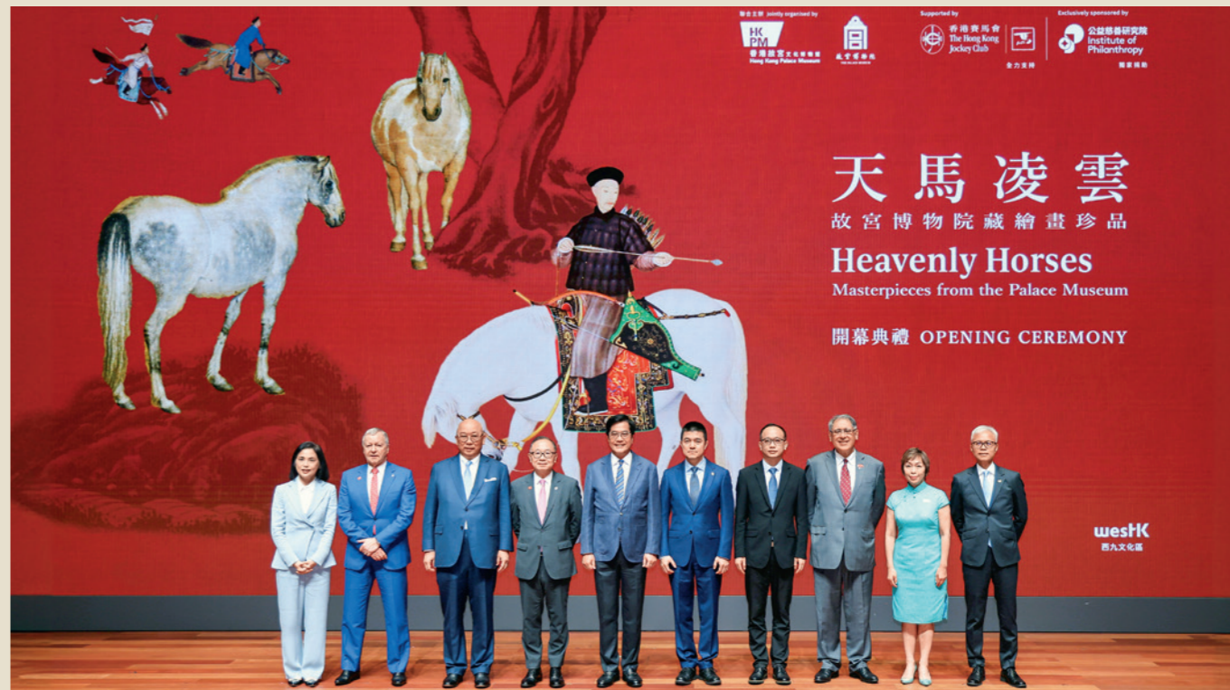
「天馬凌雲——故宮博物院藏繪畫珍品」今年三月舉行開幕典禮。主禮嘉賓包括香港特區政府財政司副司長黃偉綸（左五）、中央人民政府駐香港特區聯絡辦公室宣傳文體部副部長林柎（右四）、故宮博物院常務副院長婁璋（右五）、馬會主席廖長江（左四）、馬會副主席兼公益慈善研究院主席黃嘉純（右三）、馬會慈善信託基金信託人兼公益慈善研究院副主席龔揚恩慈（右二）、馬會行政總裁兼公益慈善研究院董事廖家柏（左二）、香港故宮文化博物館董事局主席孔令成（左三）、西九文化區管理局行政總裁馮淑儀（左一），以及香港故宮文化博物館館長吳志華博士（右一）。