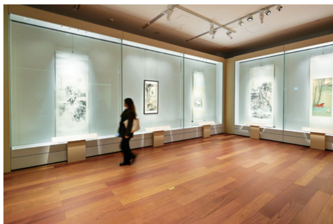
「天馬凌雲——故宮博物院藏繪畫珍品」展覽。

這次展覽為公益慈善研究院與故宮博物院五年合作計劃的重點項目之一，目的弘揚中華文化，並培育內地與香港的藝術科技人才。展覽設有人工智能互動體驗、講座及工作坊等活動，以創新數字科技令傳統文化煥發新生，讓年輕一代深入了解和欣賞中華文化，同時彰顯文化在塑造身份認同與自豪感，以及在凝聚內地與香港社會方面所擔任的重要角色。