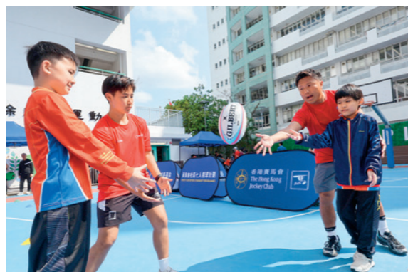
「賽馬會社區七人欖球計劃」凝聚社會投入體育盛事。