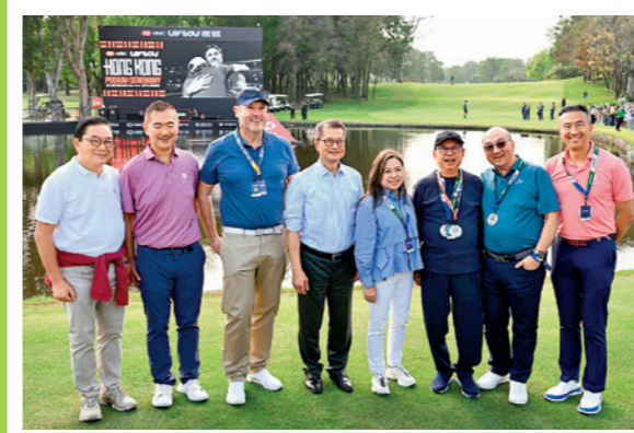
LIV Golf 2026 香港站早前在本港圓滿舉行。圖為嘉賓見證捧盃時刻，包括香港特區政府財政司司長陳茂波（左四）、香港特區政府文化體育及旅遊局局長羅淑佩（右四）、香港旅遊發展局主席林建岳博士（右三）、馬會公司事務執行總監譚志源（右二），以及香港哥爾夫球會會長郭永亮（左二）等。

大賽之前，訪港的國際高球手曾走訪小學，與學生交流，球手更獲邀體驗本地文化和美食，包括走訪中環大館及到跑馬地馬場觀賞「快活星期三」賽事，助推廣賽馬旅遊，並向世界展示香港的多元魅力，說好香港故事。