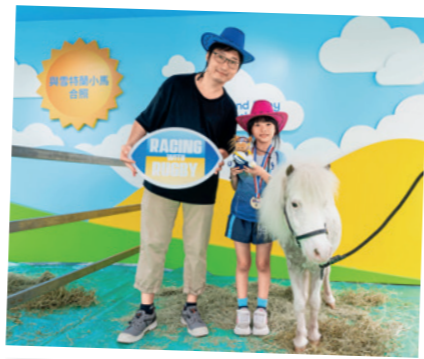
今年七欖的馬會攤位特設與雪特蘭小馬合照。

馬會連續第五年擔任「香港國際七人欖球賽」官方社區合作夥伴，並首度成為香港足球會「國際十人欖球賽」的官方社區合作夥伴。馬會透過在場館的球迷村設置互動攤位、馬會義工隊 CARE@hkjc 成員參與其中；馬會又支持外展項目及青少年欖球比賽，派發門票予學生、長者及弱勢社群，讓社會各界一同體驗欖球帶來的刺激感，惠及超過 12,000 人。