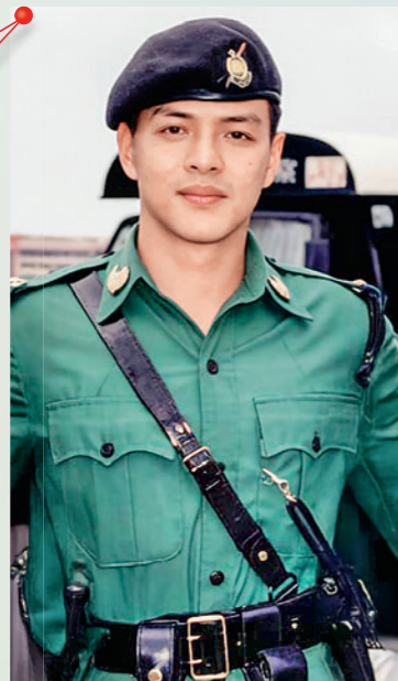
1997 年攝於機動部隊結業會操。

警務處處長周一鳴（Joe）加入警隊超過 30 年。新紮師兄當年駐守旺角，日以繼夜、晨昏顛倒的刑偵生涯，見盡正邪對決；後來加入情報科，在「木人巷」中練就出一身全能的「武功」。