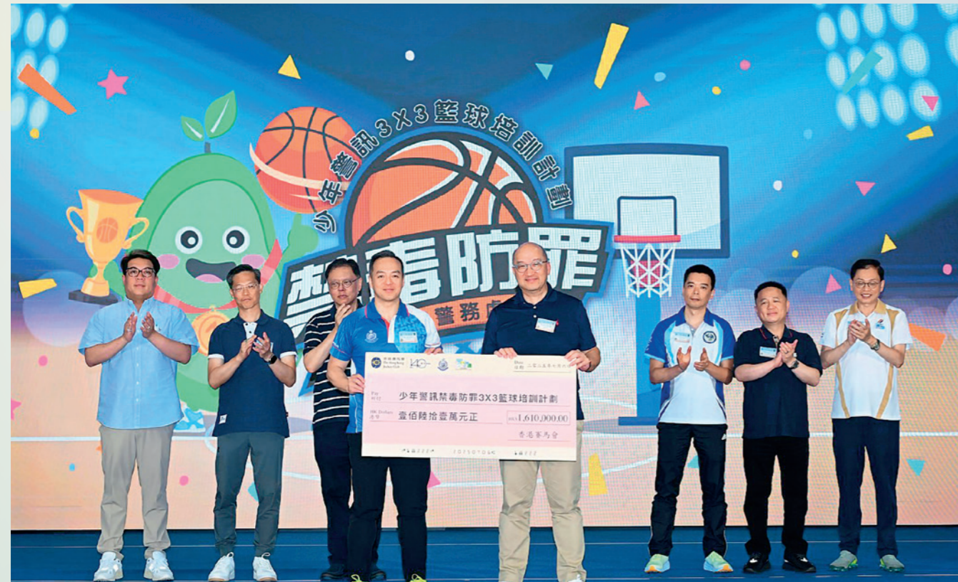
馬會支持「少年警訊禁毒防罪 3x3 籃球培訓計劃 2025」。圖為警務處處長周一鳴（前左）接受馬會公司事務執行總監譚志源（前右）代表馬會送出支票。