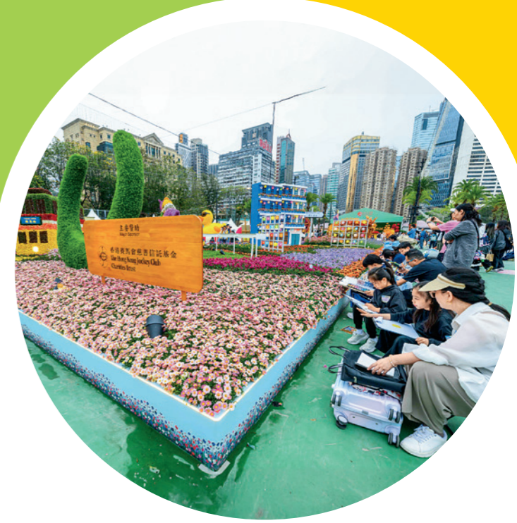
學生參與香港花卉展覽 2026 的「賽馬會學生繪畫比賽」，描繪盛放花卉的美態。