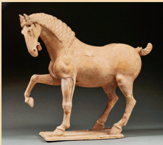
白陶舞馬 唐代 咸陽市禮泉縣張士貴墓出土 昭陵博物館藏