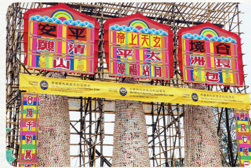
馬會自 2012 年起支持建造三座長洲太平清醮傳統大包山，並製作兩萬個寓意吉祥的「平安包」免費派給市民。