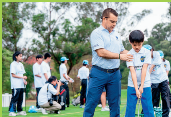
香港哥爾夫球會的高球手為來自「賽馬會亞洲高 Fun 小球手計劃」及「香港賽馬會社區資助計劃：特奧高爾夫球發展計劃」的年輕球手提供指導。