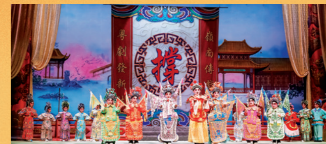
「賽馬會查篤撐兒童粵劇推廣計劃」培養學生對於粵劇藝術的欣賞及興趣。

服飾方面，粵劇早期以模仿明代的衣冠式樣製作，及後受京劇影響，兼具刺繡特色與珠片裝飾的華麗風格。粵劇化妝流行濃脂厚粉，顏色以紅、黑、白、藍、黃為主，用以象徵角色性格忠奸，而不同角色皆有獨特的化妝方式。