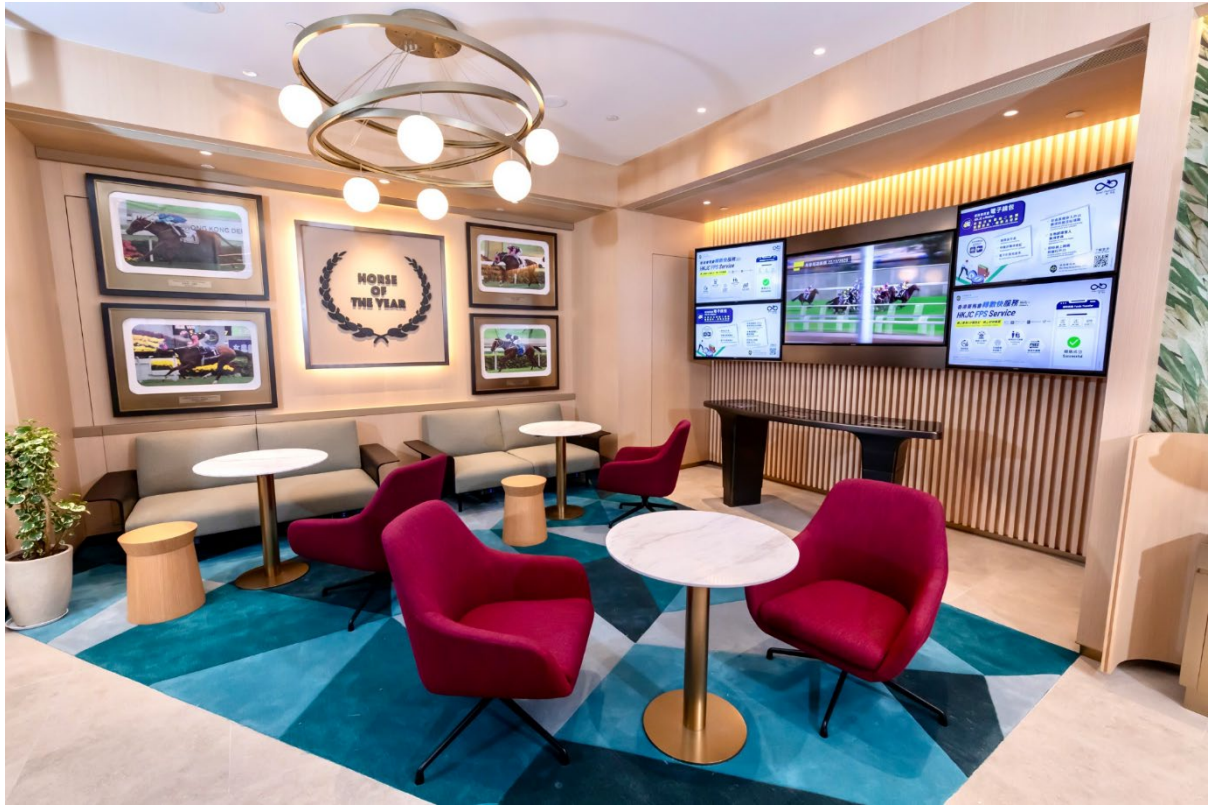
休閒專區及 App-Touch Table