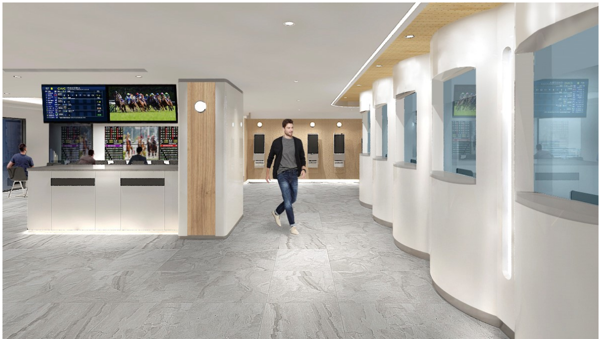
投注大堂及影視大堂