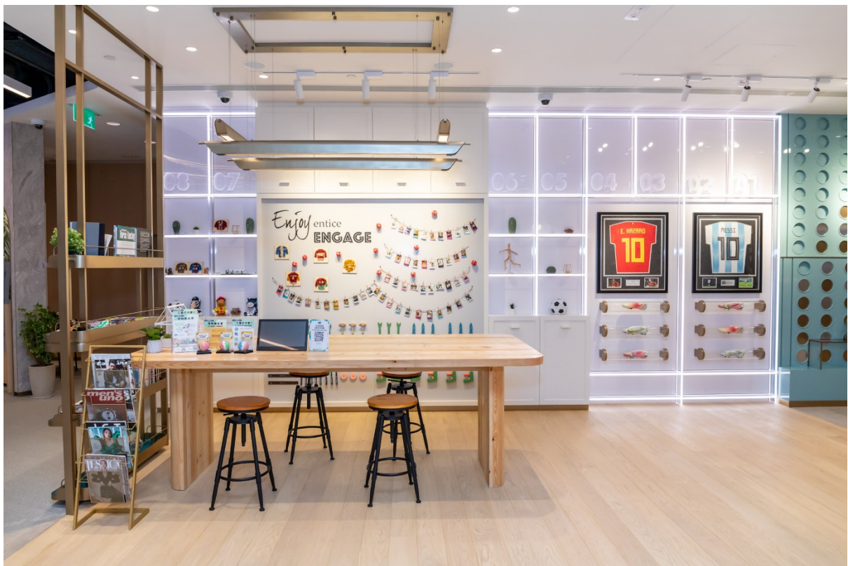
工作坊專區及以足球為主題的特色打卡牆