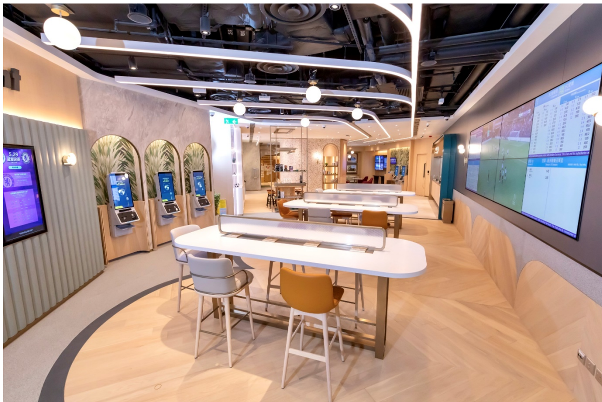
共享區域及作賽事直播的大型電視屏幕