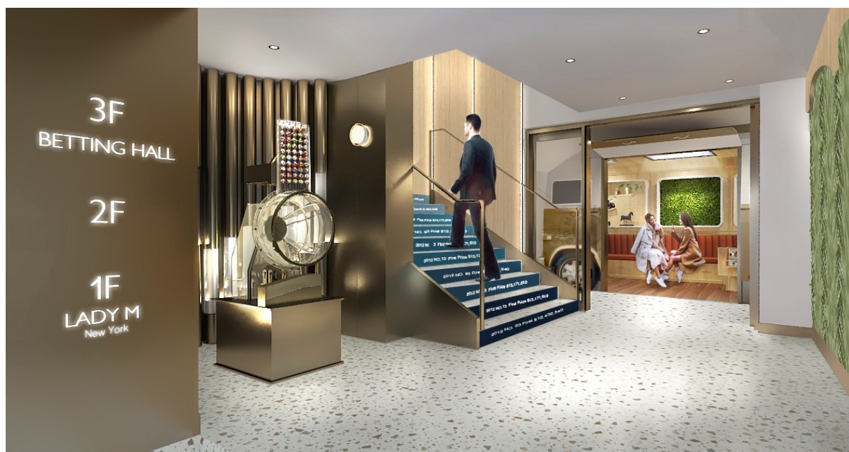
快捷戶口服務及打卡熱點