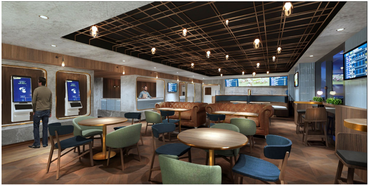
迎合男士們的休閒專區