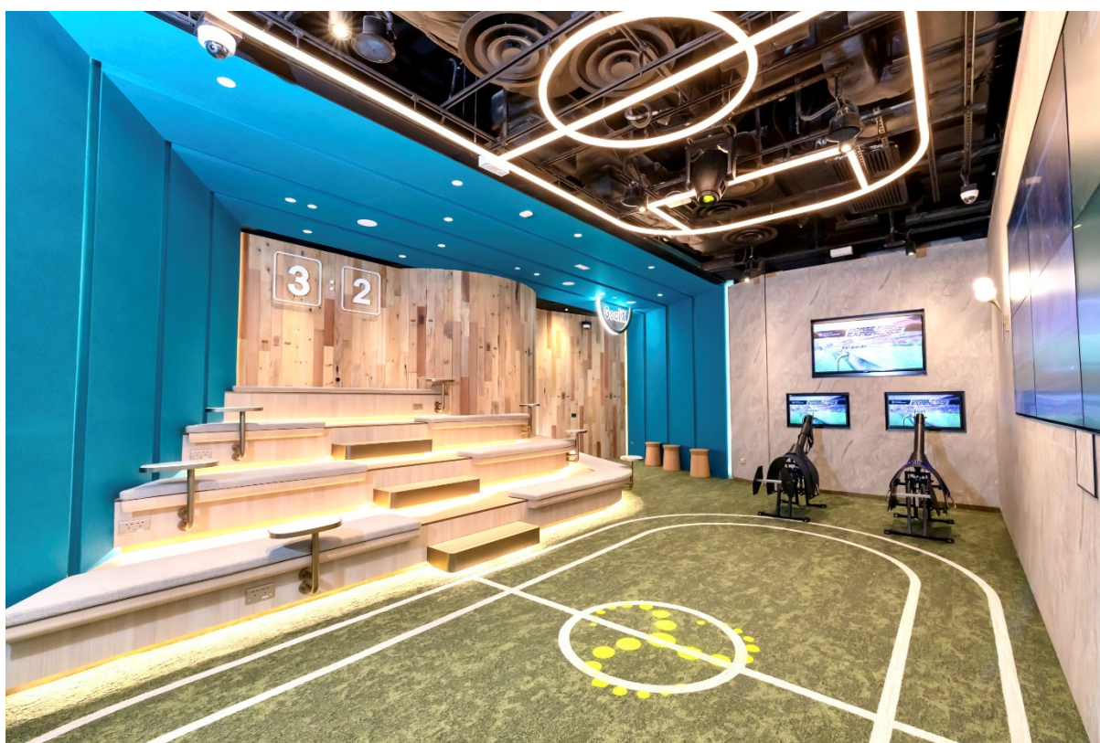
活動及遊戲專區及以再生木材製作的木牆裝飾