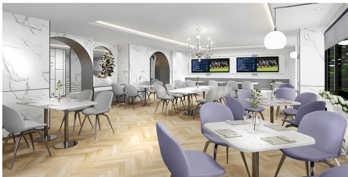
迎合女士們喜愛的咖啡室